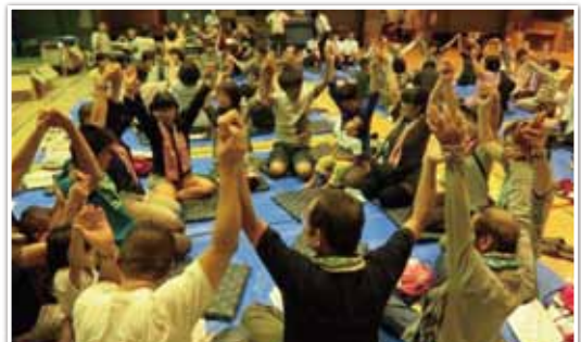
防災レクリエーション

③の行政に対しては、特別支援学校や福祉施設に障害者が最初から避難できる体制を整えて欲しいという意見が多かったです。現状では、まず学校区の一般避難所に行き、そこでは無理だと判断された後、福