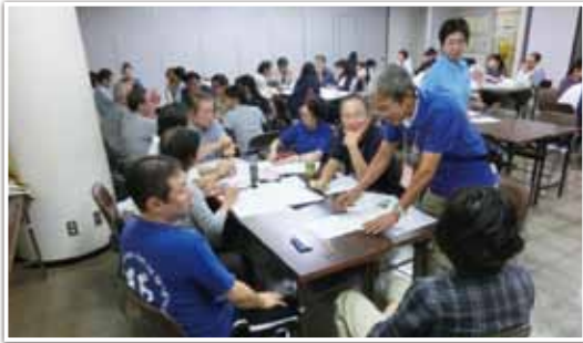
防災ラジオドラマ制作の様子