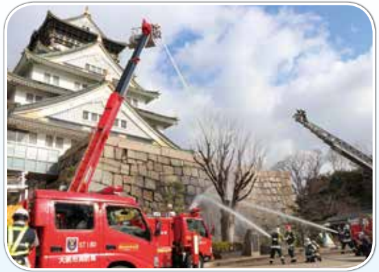
大阪市大阪城 (1月29日)