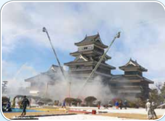
長野県松本市松本城 (1月26日)