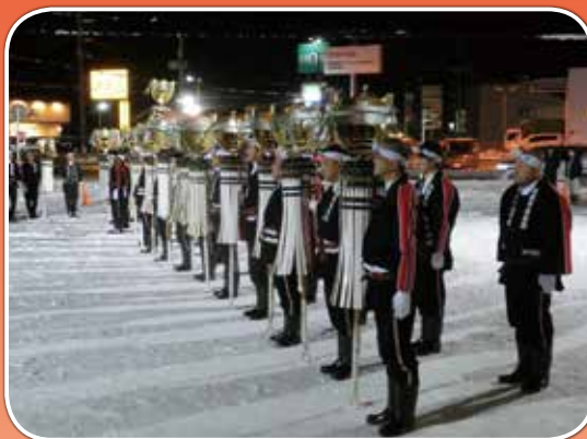
秋田県大館市 (1月6日)