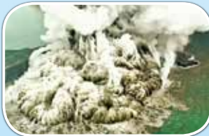
アナク・タラカタウ山