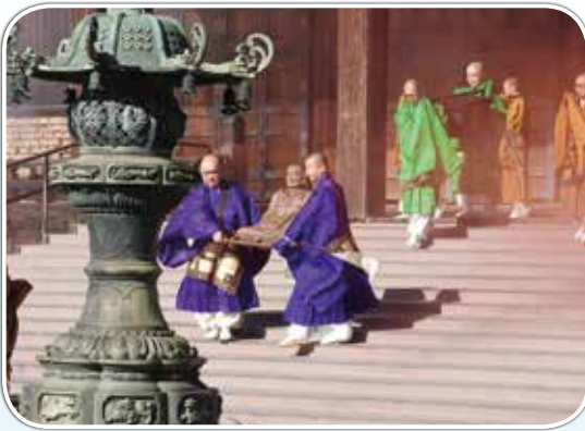
東京都護国寺 (1月24日)