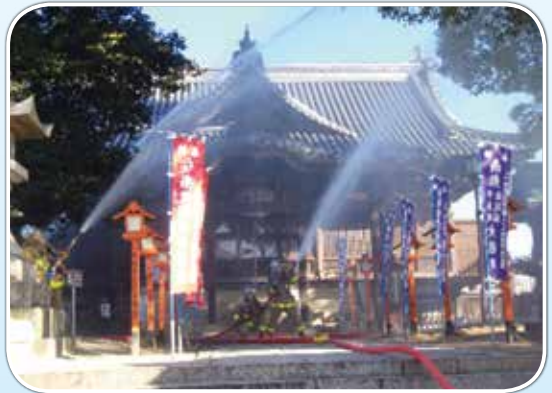
岡山市西大寺観音院 (1月26日)