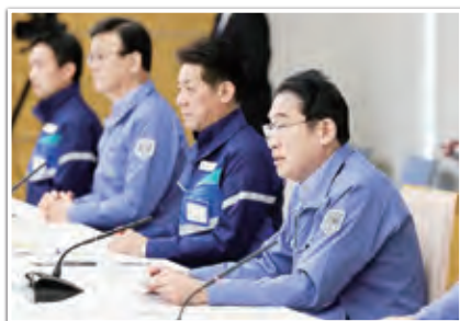
第1回非常災害対策本部会議

食料、飲料水、毛布、携帯トイレ等の緊急性を要する物資に加えて、防寒着、暖房器具や燃