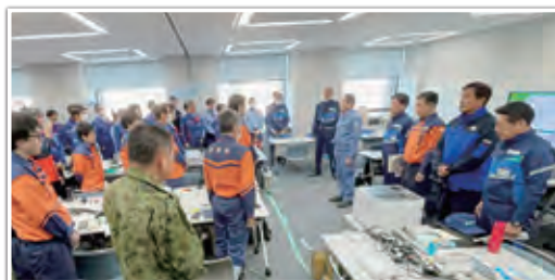
岸田内閣総理大臣による非常災害現地対策本部（石川県庁内）での激励（1月14日）