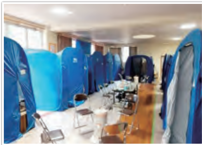
避難所内生活スペース（珠州市）

被災地では11万棟を超える住家が被害を受け、住まいの確保が喫緊の課題となったが、特に奥能登地域では、住宅建設に適した平地に限られることに加え、建設工事従事者のための宿泊拠点が少なく、道路・水道等の復旧にも時間を要したため、住まいの確保に向けた取組は難航した。