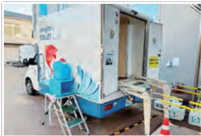
トイレカー（愛媛県宇和島市から派遣）