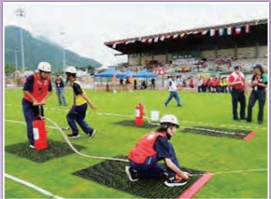
障害物競技の様子