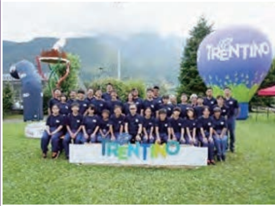
日本少年消防クラブメンバー