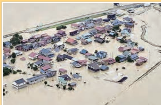
山形県戸沢村（河川氾濫：令和6年7月26日（金））