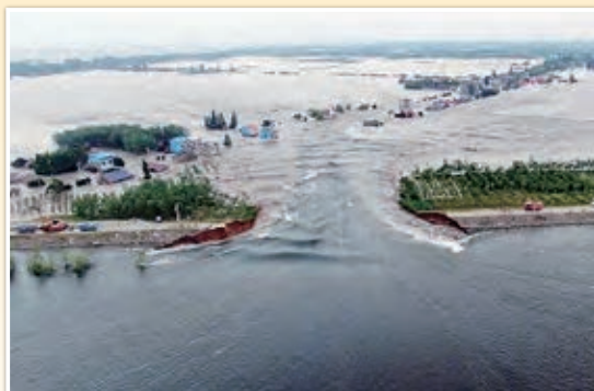
中国南部・湖南省（豪雨：2024年7月6日（土））