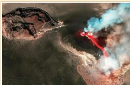
イタリア・シチリア島エトナ火山（火山噴火：2024年7月8日（月））