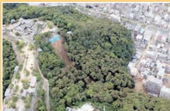
愛媛県松山市緑町（土砂災害：令和6年7月12日（金））

日本では7月に入り、各地で梅雨前線による被害が発生しました。写真はその一例です。