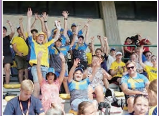
会場観覧席の様子