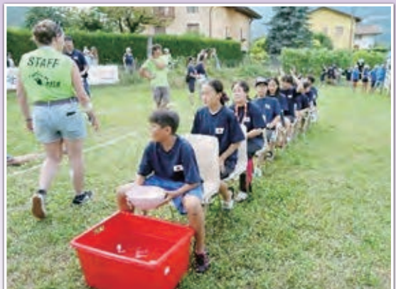
キャンプオリンピック競技の様子