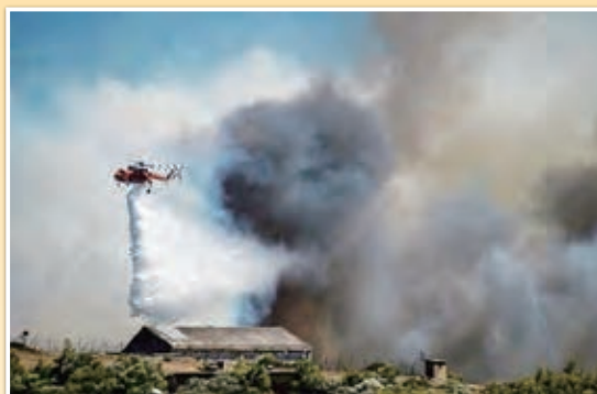
ギリシャ（山火事：2024年6月下旬）