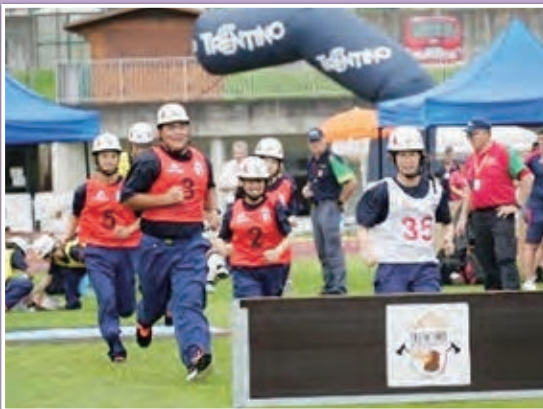
障害物競技の様子