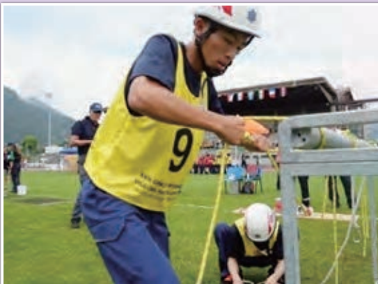
障害物競技の様子