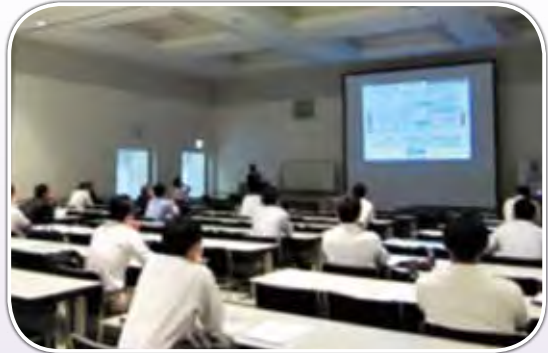
地方公共団体職員、消防職員、その他35名が参加した。