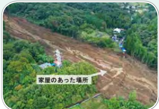
令和元年10月の東日本台風により神奈川県相模原市で発生した土砂災害(ドローン空撮画像)