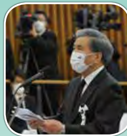
蒲島郁夫熊本県知事 (主催者式辞)