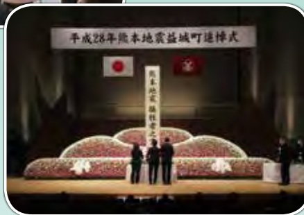
熊本地震益城町追悼式