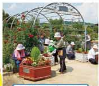
フラワープランター