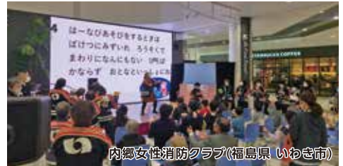
内郷女性消防クラブ(福島県 いわき市)