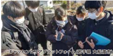
キャッセンエリアプラットフォーム(岩手県 大船渡市)