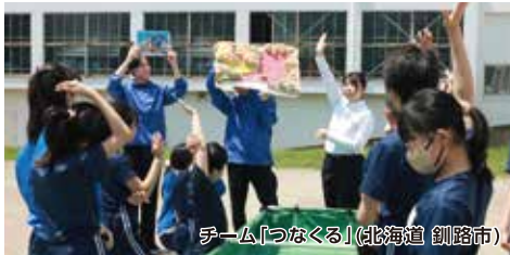
チーム「つなぐる」(北海道 釧路市)