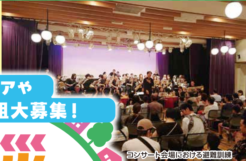
コンサート会場における避難訓練