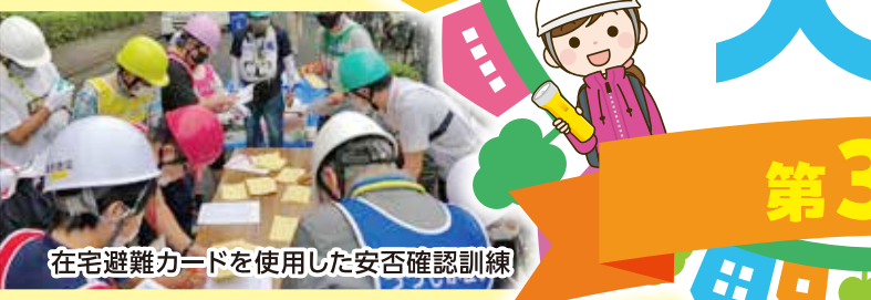
在宅避難カードを使用した安否確認訓練