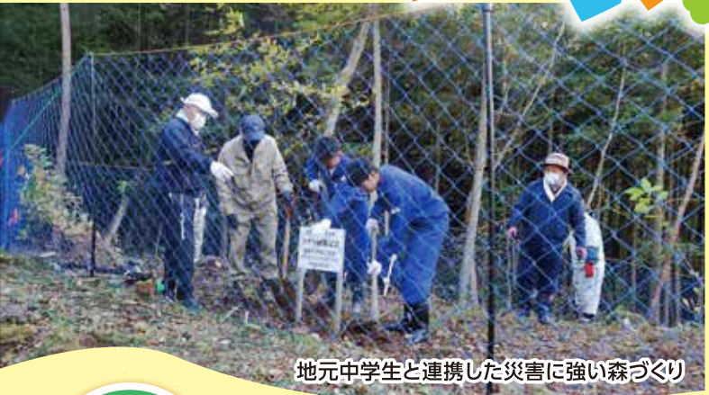
地元中学生と連携した災害に強い森づくり