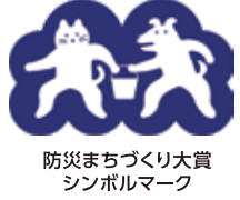
防災まちづくり大賞 シンボルマーク

阪神・淡路大震災や東日本大震災など、近年の大規模な災害の教訓を踏まえて、防災・減災・防火対策に関する優れた取組、アイデアなどを表彰し、災害に強い安全なまちづくりの一層の推進に資することを目的として、平成8年に創設されたものです。