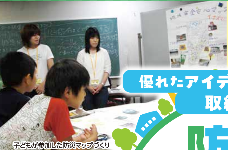
子どもが参加した防災マップづくり